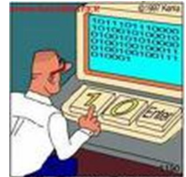
I veri programmatori di codice binario

Agli studenti delle classi quarte CAT/TUR/AFM-RIM-SIA