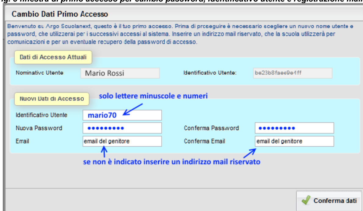
Fig. 3 finestra di primo accesso per cambio password, identificativo utente e registrazione mail.

Dopo aver digitato tutti i dati richiesti, cliccare su "Conferma dati", a questo punto il sistema avviserà dell'avvenuta registrazione dei dati e provvederà ad inviare una mail di promemoria al vostro indirizzo e.mail.